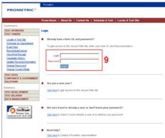
9. Deste ponto em diante entra a parte burocrática onde você terá que fazer Login no site, ou criar um Login gratuitamente .