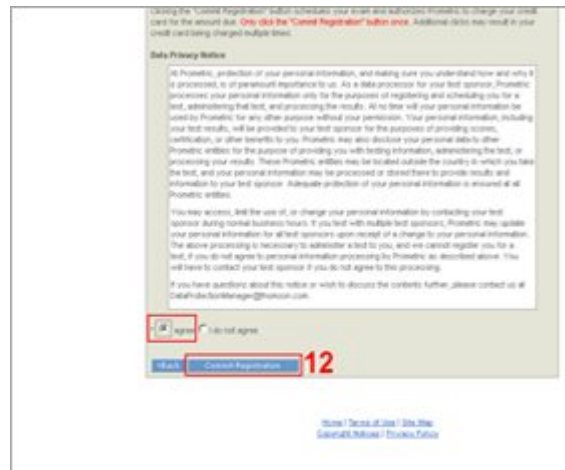
12. Agora você poderá usar um Voucher (se tiver), conferira os dados para pagamento e por fim marcar a opção Agree e clicar em Commit Registration . Pronto.