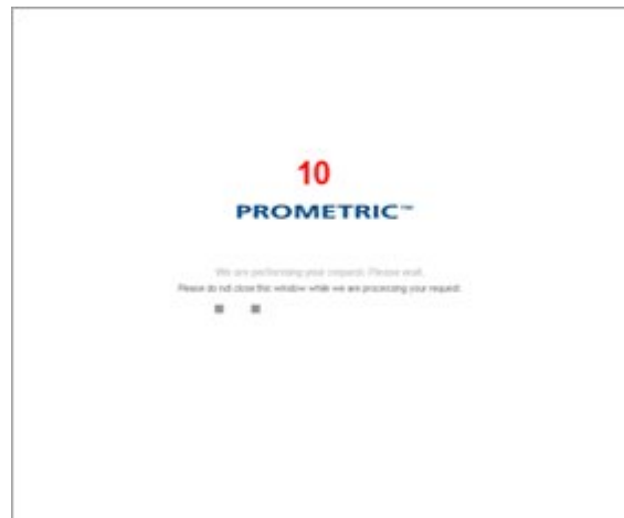
10. O sistema da Prometric vai te autenticar no site para dar seqüência ao processo.