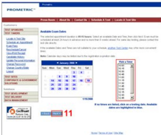
11. Selecione a data e o horário que estiver disponível no local escolhido e clique NEXT .